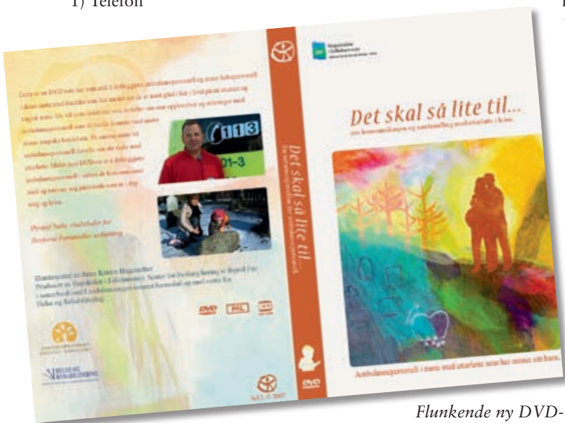
Flunkende ny DVD-samling til bruk i undervisning av ambulans- og annet helsepersonell.

- Foreldrene ønsker å bli møtt på en måte som viser at personellet bryr seg, at de