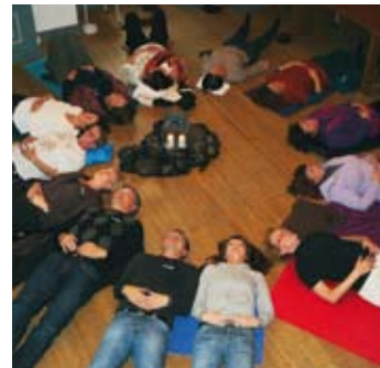
Avkobling etter endt økt