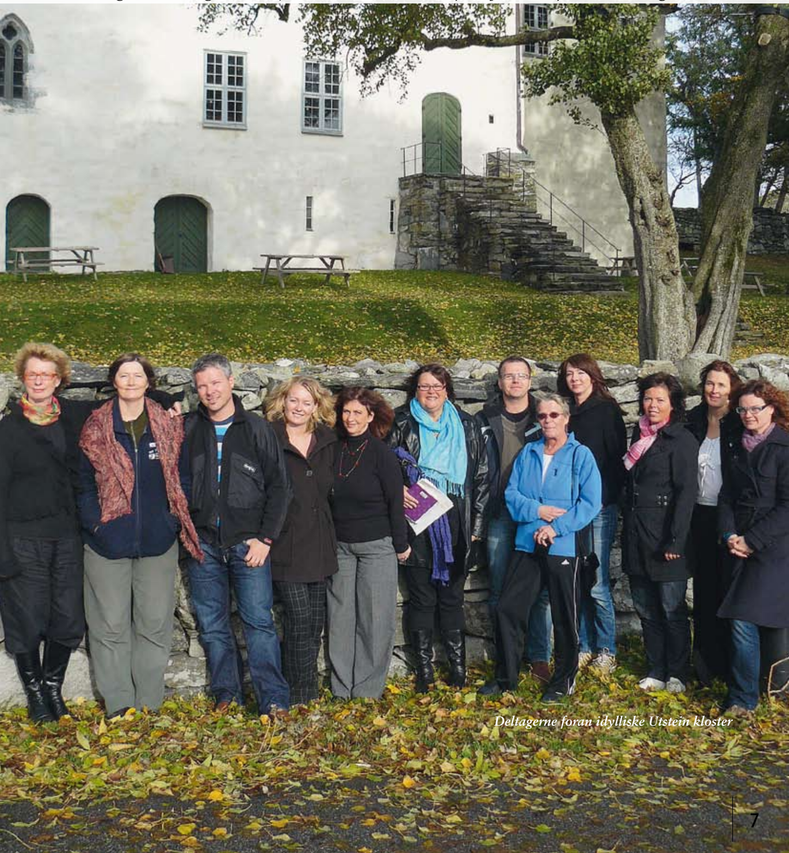
Deltagerne foran idylliske Utstein kloster