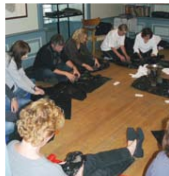
Innlevelses-øvelse med leire

- Sorgen bærer man på selv om tiden går. Behovet for å få uttrykke sin sorg tror jeg finnes hos alle, og da, midt i bråket og lar-men rundt oss, kan det være godt å få være stille, kunne lytte til sin indre røst, og la kroppen få "minnes" det som har skjedd. Å la kroppen få uttrykke innestengte følelser kan gjøre at noen av sårene leges. Gå litt langsommere, pust litt roligere, la tankene få komme og gå som de vil, å få møte andre uten krav – det er det Stille dager dreier seg om, avslutter Ganters.