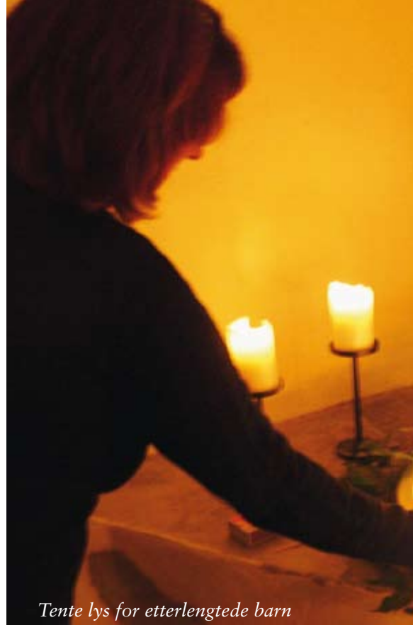
Tente lys for etterlengtede barn

- Den estetiske rammen er svært viktig under et slikt arrangement. Stedet må innby til ro, og det fant vi her, sier hun.