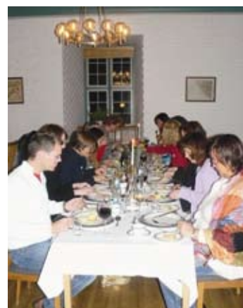
Stillhet og vakker musikk til frokosten