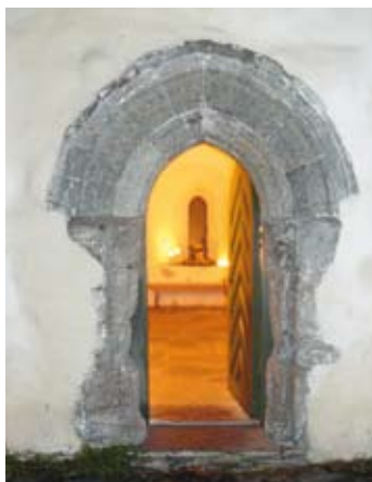
Stemningsfull lystenning i klosterets eldste rom.