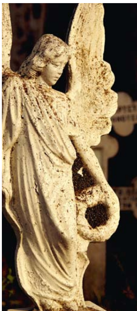
Engler er et symbol som også brukes av ikke-troende.

Sorg er en naturlig reaksjon på tap. Det er stor forskjell på våre individuelle, sosiale og kulturelle forutsetninger for å takle kriser. Likefullt er det hevet over tvil at de som får nødvendig hjelp og har et godt nettverk med gode venner og familie, kommer seg "lettere" gjennom tragedier enn de som føler seg alene med sorgen. Men hvilken betydning kan tro ha i kriser?