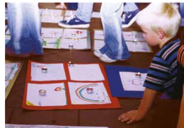
Barn deltar i minnestund for sine døde søsken.

Dersom dere opplever samlivsproblemer og/eller andre relasjonsproblemer i familien etter å ha mistet barn, kan dere få hjelp ved familievernkantor. Både enkeltpersoner, par og familier kan ta kontakt. Tilbudet er gratis, og det er ikke nødvendig med henvisning. På kontorene arbeider i hovedsak psykologer og sosionomer med videreutdanning i familierapi.